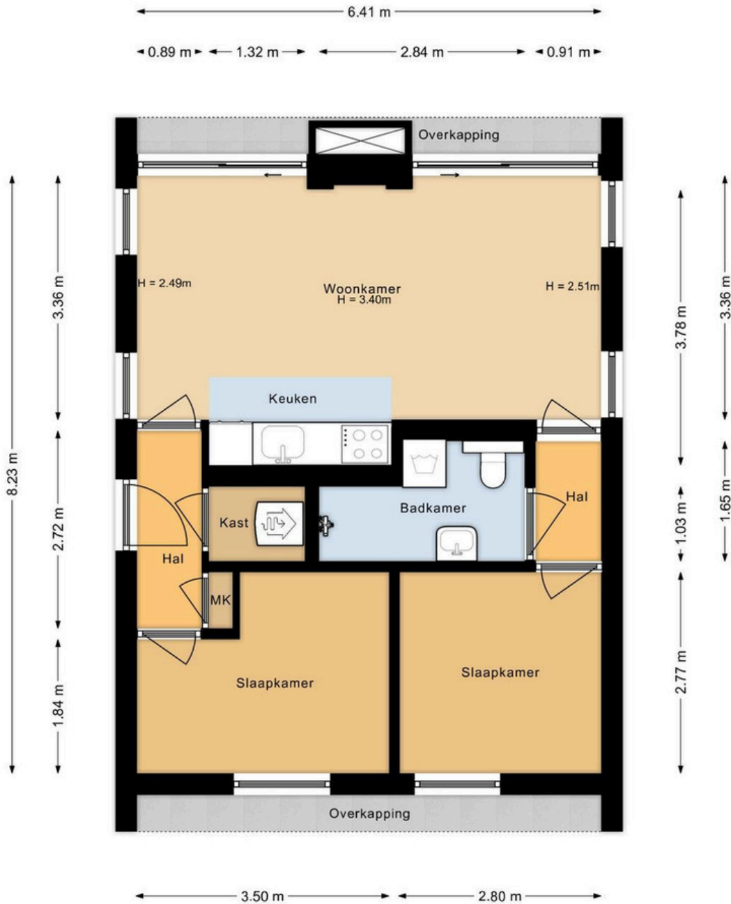
Appartement Hofdijklaan 55 R24 Oud Ade